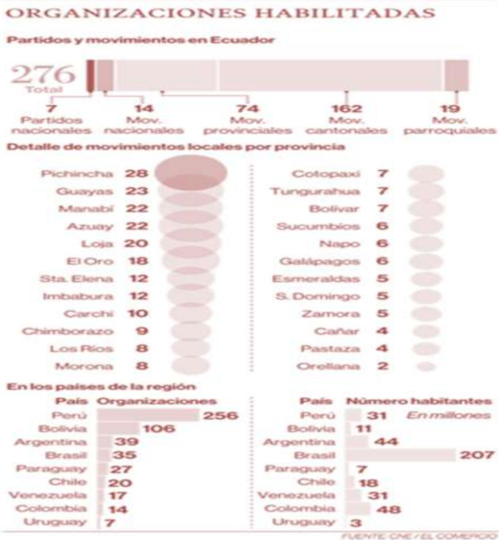
Figura 1. Organizaciones políticas Ecuador. Diario El Comercio. Agosto, 2018.