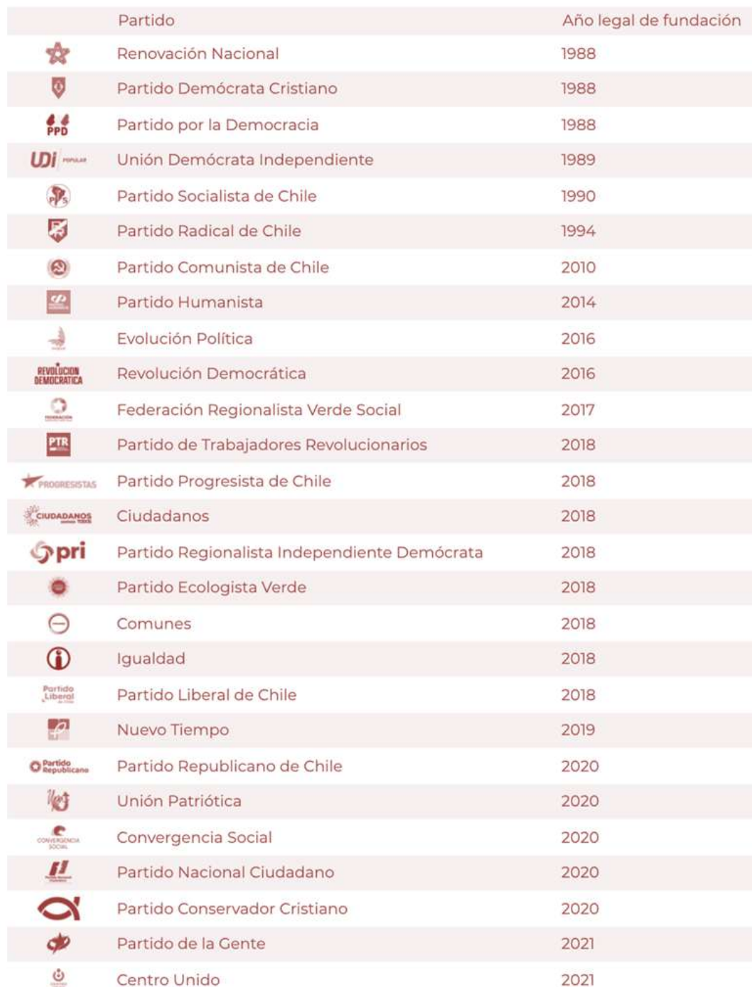
Figura 3. Partidos políticos en Chile. Elaborado con información de INFOGATE, octubre 2021.