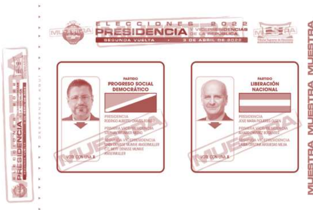
Figura 2. Muestra de papeleta facilitada para su uso en los procesos electorales infantiles, 3 de abril de 2022.

receptoras de votos, y se registró una participación de 35 114 votantes 8 . Al igual que en la elección del 6 de febrero, en esta oportunidad el TSE facilitó una muestra de la papeleta nacional, para que se utilizase en el proceso electoral infantil (figura 2).