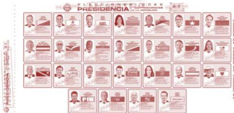
Figura 1. Muestra de papeleta facilitada para su uso en los procesos electorales infantiles, 6 de febrero de 2022.

Un aspecto por destacar es la favorable opinión de las misiones de observación electoral sobre la celebración de estas elecciones, las cuales fueron valoradas como un excelente ejercicio de formación ciudadana. Tanto observadores de la Unión Interamericana de Organismos Electorales (UNIORE) como de la Organización de Estados Americanos (OEA) expresaron públicamente su beneplácito por ser testigos de estos procesos electorales. En ese sentido, al cierre de la primera ronda, el informe preliminar de la OEA indicó lo siguiente: “la Misión saluda la iniciativa de las elecciones infantiles implementadas por el Tribunal en los comicios de 2022, que califica como una buena práctica de aprendizaje y construcción de ciudadanía” (OEA, 2022, p. 6) 6 .