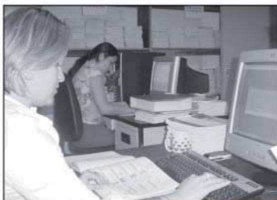
Un grupo de funcionarios se encargaron de incorporar en una base de datos diseñada para ese fin el dato de las personas que votaron en los comicios municipales.