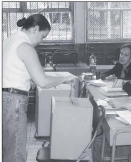
Para las Elecciones Municipales el padrón ascendía a 2.603 770 ciudadanos, pero sólo acudieron a las urnas 620614 ciudadanos.

• Participaron aproximadamente 80 observadores internacionales.