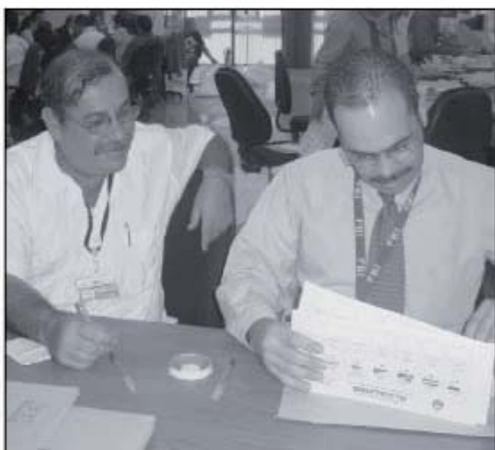
El escrutinio de los comicios municipales duró tan sólo 14 días.

En febrero del 2006 solamente el Partido Acción Ciudadana (PAC) solicitó la impugnación de 681 juntas receptoras de votos. El Tribunal Supremo de Elecciones (TSE) rechazó la totalidad de las demandas por haberse presentado en forma extemporánea, por falta de elementos probatorios, porque la ausencia del Padrón Registro o la certificación no es causal de nulidad en la legislación electoral y por la desestimación de alegatos contra la Fiscalización del Escrutinio y contra el Reglamento de Integración Extraordinaria