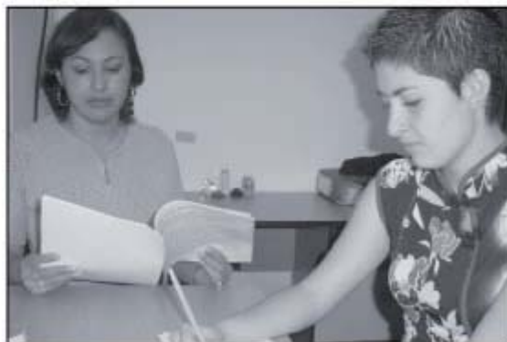
El programa de Declaratorias tenía que definir las personas que quedaron electas en cada uno de los 4951 puestos que estuvieron en disputa en diciembre del año pasado.

Por último, el Programa se encargó de revisar las credenciales antes de entregárselas a las personas electas.