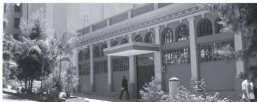
Sobre el otrora Paseo de las Damas se ubica el antiguo edificio de la Quinta Comisaría. Hoy pasa por una intensa etapa de remodelación a cargo de su nuevo propietario.

"En un principio se habían destinado 100 millones de colones para dicha remodelación, pero como la construcción de la Regional de Cartago se ha atrasado, se tuvieron que destinar recursos de ahí para terminar de construirla", informó Viquez.