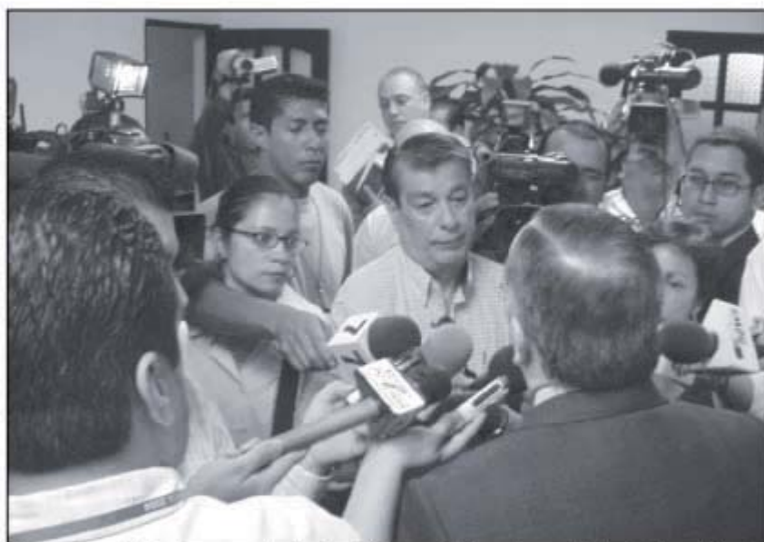
Los ganadores del primer lugar en cada categoría recibirán una estatuilla en bronce alegórica al Epítome del Vuelo.

La declaratoria de los trabajos ganadores podrá ser individual, grupal (cuando el trabajo premiado haya sido realizado por dos o más periodistas) o desierto cuando el Jurado Calificador determine que ninguno de los trabajos presentados ameritan el