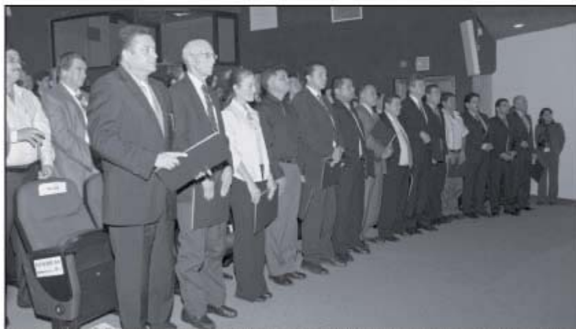
Los alcaldes electos en diciembre pasado recibieron su credencial el pasado 31 de enero en el Auditorio del TSE.

Alcaldes reelectos Esta es la segunda vez que se eligen popularmente los alcaldes, por lo cual, en 25 de las 81 municipalidades del país, hay alcaldes que tendrán un periodo