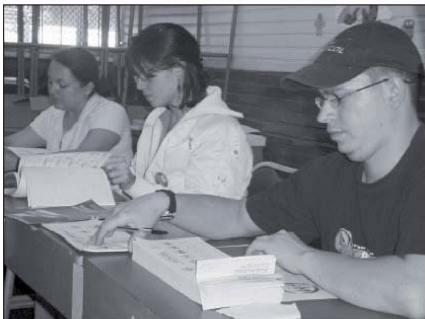
Alededor de 9829 personas trabajaron como auxiliares electorales en diciembre pasado. La mayoría recibió su pago a tiempo; sólo 200 tuvieron algunos inconvenientes que el TSE ya solventó

En las próximas semanas realizarán la evaluación del programa para encontrar virtudes y defectos del mismo.