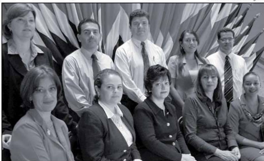
Comisión de Género del TSE

Durante el mes de noviembre se llevó a cabo la etapa del diagnóstico, contemplando revisión documental, entrevistas a informantes clave, análisis de situación institucional, talleres de sensibilización y capacitación de funcionarios de sede central y regionales así como la conformación de un grupo focal con personas integrantes de organizaciones e instituciones especialistas en derechos políticos de las mujeres.