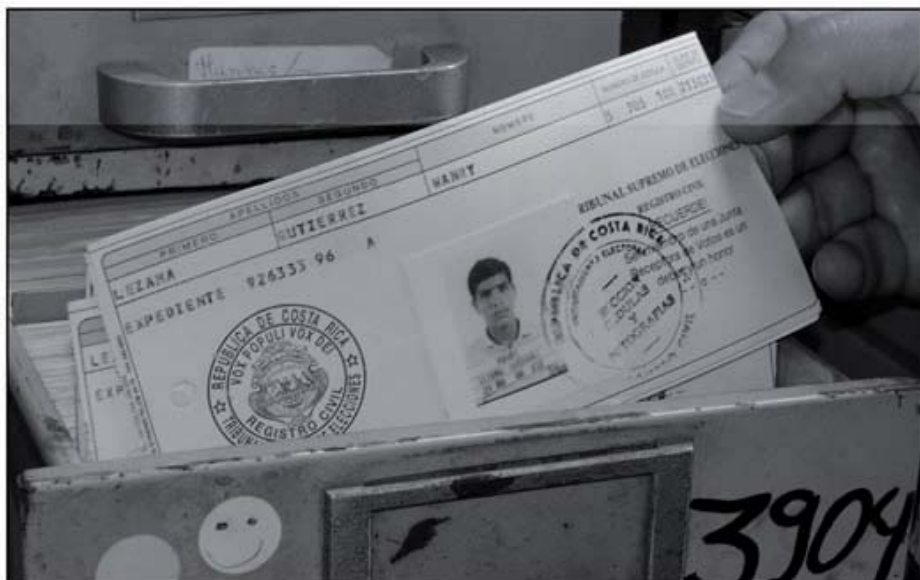
A finales del mes de octubre, el Tribunal Supremo de Elecciones (TSE) comenzó a empacar en sacos el padrón fotográfico utilizado en las pasadas elecciones presidenciales de 1998

Se estima que la cantidad de tarjetas del padrón fotográfico que se piensa desear son aproximadamente 2 millones 45 mil 332, o sea, la misma cantidad