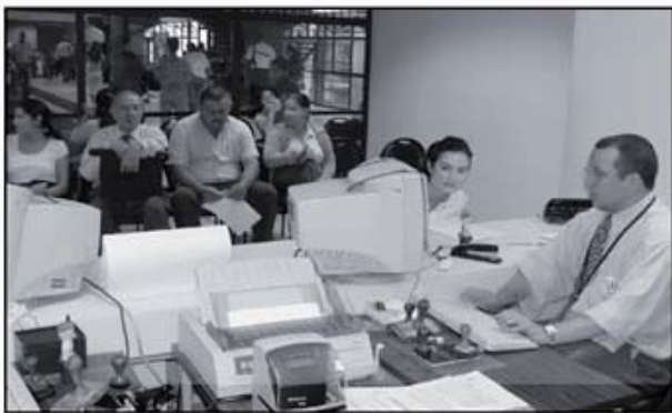
El PEI busca dentro de sus metas el mejoramiento del servicio institucional.

La idea de este PEI es mejorar la calidad de los servicios que presta el TSE, incorporando componentes tecnológicos y orientado al "gobierno digital" en la mayoría de las acciones, con el propósito de fortalecer la capacidad técnica y dar a los usuarios los servicios de una forma más expedita.