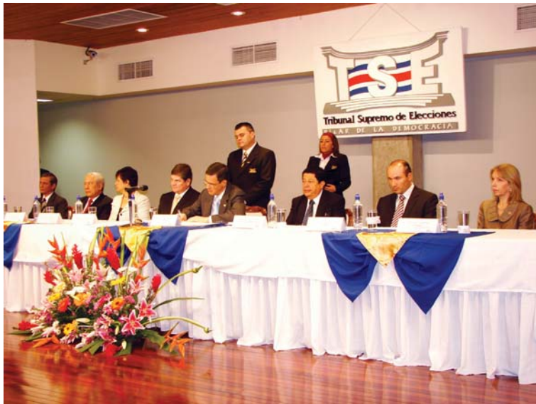
Según el artículo 147 del Código Electoral, la convocatoria a elecciones se realiza 4 meses antes de la celebración de las elecciones.

El pasado 5 de agosto los Magistrados del Tribunal Supremo de Elecciones (TSE) realizaron la convocatoria a las elecciones municipales. Dicha actividad convocó a todos los ciudadanos inscritos en el padrón electoral para que -ejerciendo el derecho constitucional al sufragio en votación obligatoria, directa y secreta- concurren a las respectivas juntas receptoras de votos (JRV) el día de los comicios.