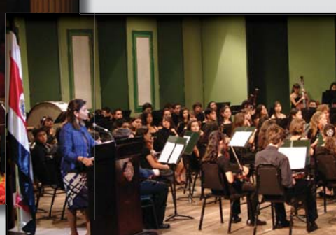
El homenaje oficial del 60 aniversario del sufragio femenino se realizó en el Teatro Melico Salazar el 28 de julio. Contó con la participación de altas personalidades de gobierno y de la sociedad civil. Las jóvenes de la Sinfónica Juvenil Intermedia deleitaron a los participantes. El día 30 de julio hubo una actividad conmemorativa en La Tigra de San Carlos.