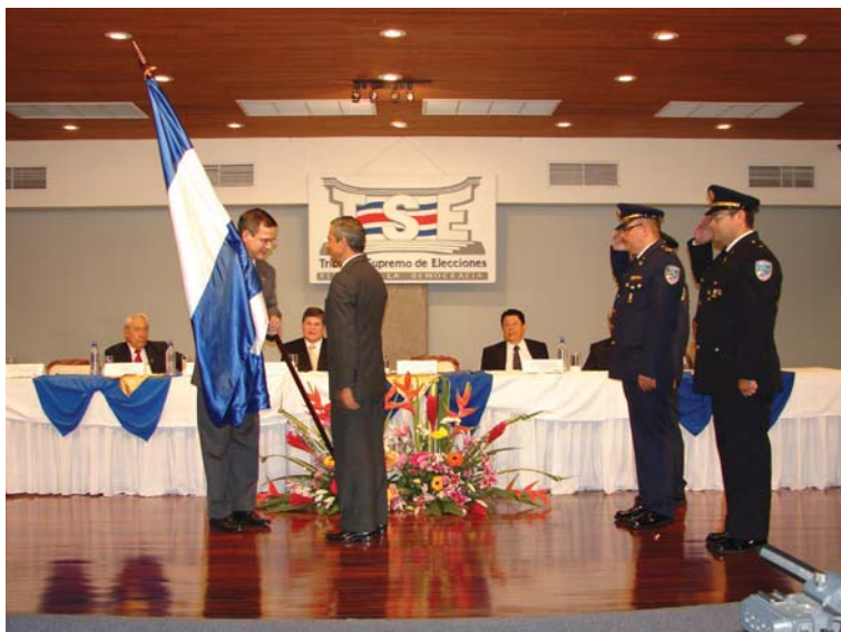
Durante la convocatoria también se realizó el acto simbólico del traslado de la Fuerza Pública a manos del TSE, haciéndose efectivo el mandato contenido en el artículo 102 inciso 6) de la Constitución Política.

Según el artículo 147 del Código Electoral, la convocatoria a elecciones se realiza 4 meses antes de la celebración de las elecciones.