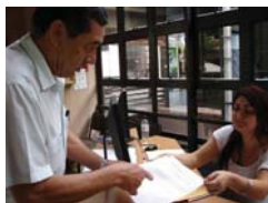
Panameños estudian posibles reformas electorales

En julio pasado la Comisión Electoral Provisional de Haití inició el registro de los partidos políticos que participarán en los comicios legislativos y presidenciales del próximo 28 de noviembre. Al menos 55 agrupaciones partidarias tuvieron la oportunidad de presentar sus nominaciones para aspirar a 30 escaños del Senado y 99 de la Cámara de Diputados.