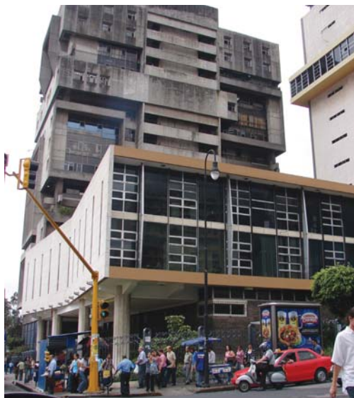
El Tribunal Supremo de Elecciones (TSE) dispuso que durante las elecciones municipales no se aplicará la veda publicitaria establecida en el artículo 142 del Código Electoral. Instituciones como la Caja Costarricense del Seguro Social, por ejemplo, podrán pautar anuncios relativos al giro de su gestión.

El Tribunal Supremo de Elecciones (TSE) dispuso que durante las elecciones municipales no se aplicará la veda publicitaria establecida en el artículo 142 del Código Electoral.