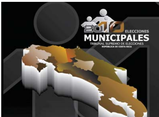
Los usuarios de la página www.tse.go.cr tienen la posibilidad de conocer quiénes serán los candidatos a alcalde de todas las municipalidades del país.

Tanto el fichero cantonal, el fichero del candidato y el programa televisivo "Costa Rica Elige" forman parte del proyecto "Votante informado" elaborado por el IFED, que lo que pretende es que la ciudadanía pueda emitir un voto informado.