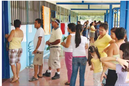
Los observadores nacionales tendrán libre comunicación con todas las organizaciones participantes en el proceso y tendrán acceso a las juntas receptoras de votos.

Para las elecciones municipales, a celebrarse este 5 de diciembre, las obligaciones y accionar de los observadores nacionales e internacionales se encuentran reglamentados para beneficio de los comicios y de la organización electoral, según lo dispuso el Tribunal Supremo de Elecciones (TSE).