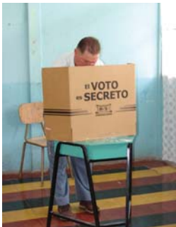
El TSE habilitó 5250 juntas receptoras de votos en las que podrán participar los más de 2 millones 800 ciudadanos que conforman el padrón electoral.

2 865 509 electores podrán votar el próximo 5 de diciembre de 2010, día en que se realizarán las elecciones municipales, de los cuales 1 430 519 son hombres y 1 434 990 son mujeres.