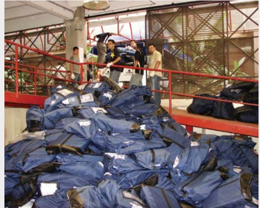
El proceso de reciclaje de 90 toneladas de material electoral tardó dos semanas en concluir.

proceso de eliminación de materiales el TSE se asegura que no aparezcan papeletas auténticas en lugares diferentes a su centro de custodia y destrucción.