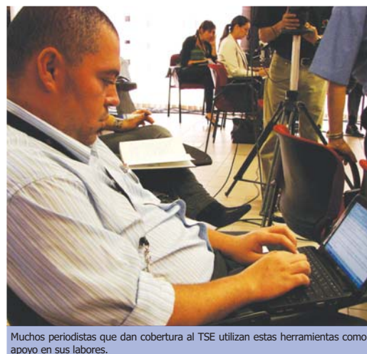
Muchos periodistas que dan cobertura al TSE utilizan estas herramientas como apoyo en sus labores.

Al 16 de noviembre pasado, el TSE tenía 4300 admiradores en Facebook, 2485 seguidores en Twitter y 2205 visitas en Youtube.