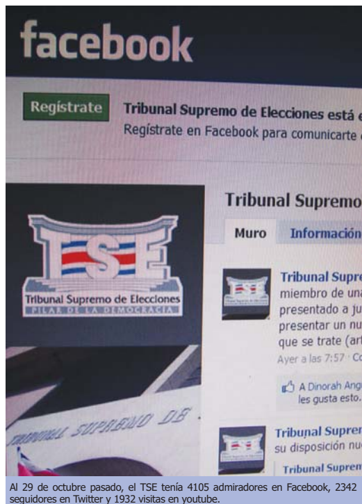
Al 29 de octubre pasado, el TSE tenía 4105 admiradores en Facebook, 2342 seguidores en Twitter y 1932 visitas en youtube.

Desde el pasado mes de enero, el Tribunal Supremo de Elecciones (TSE) cuenta con un espacio dentro de los perfiles de redes sociales donde da a conocer informaciones oficiales relativas a su quehacer institucional, razón por la cual, el pasado 10 de agosto,