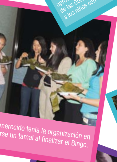
Bien merecido tenía la organización en comerse un tamal al finalizar el Bingo.