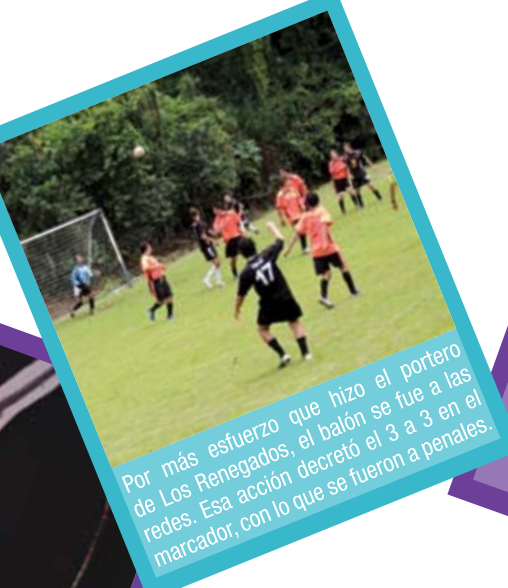
Por más esfuerzo que hizo el portero de Los Renegados, el balón se fue a las redes. Esa acción decretó el 3 a 3 en el marcador, con lo que se fueron a penales.