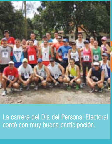
La carrera del Día del Personal Electoral contó con muy buena participación.