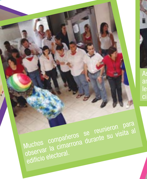
Muchos compañeros se reunieron para observar la cimarrona durante su visita al edificio electoral.