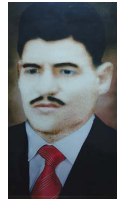
Retrato de Timoleón Morera Soto donado al Tribunal Supremo de Elecciones (TSE) por la escuela que lleva el nombre del héroe electoral.

Precisamente, el día de la entrega de dicho retrato, la Magistrada Castro mencionó que "para el TSE es un orgullo hacerse presente a tan importante actividad, donde recibimos con inmensa gratitud tan valiosa donación, voy a solicitar que el Instituto de Formación y Estudios en Democracia (IFED) realice actividades para dar a conocer lo que hizo