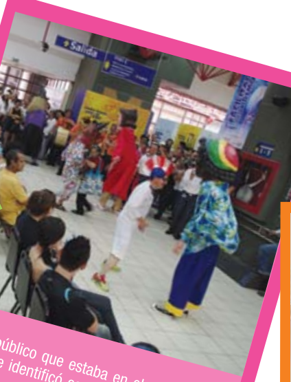
Hasta el público que estaba en el despacho de Cédulas, se identificó con el paso de la "alegre cimarrona".