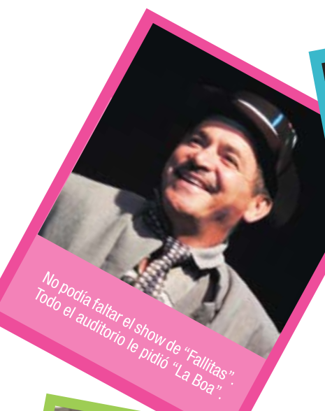
No podía faltar el show de "Fallitas". Todo el auditorio le pidió "La Boa".