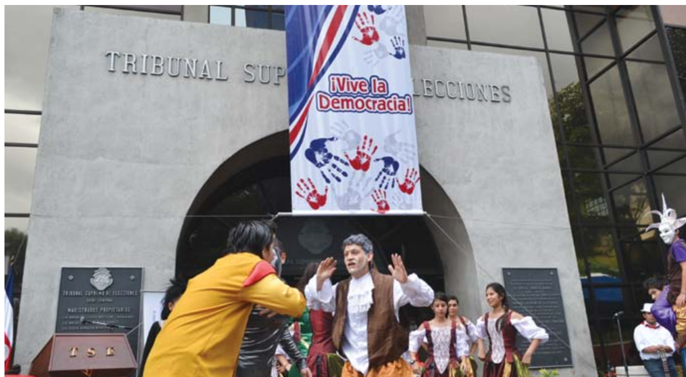
Dentro de la celebración del Día de la Democracia, organizada por el IFED, los concurrentes pudieron disfrutar de diversidad de presentaciones artísticas.

"La democracia es una forma de vida y un proyecto de sociedad en constante construcción que se fundamenta en valores, actitudes y destrezas como el diálogo, la solidaridad, la tolerancia, el respeto, el reconocimiento de la diversidad y la participación. La democracia goza de una superioridad ética respecto a cualquier otro sistema político, pues es el único que parte del reconocimiento de la dignidad de todos los seres humanos, valora la heterogeneidad y reconoce el pluralismo; con base en