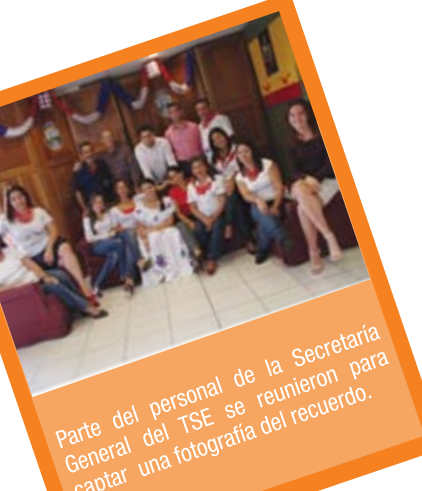
Parte del personal de la Secretaría General del TSE se reunieron para captar una fotografía del recuerdo.