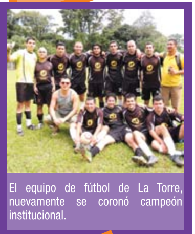
El equipo de fútbol de La Torre, nuevamente se coronó campeón institucional.