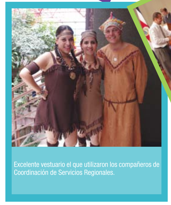
Excelente vestuario el que utilizaron los compañeros de Coordinación de Servicios Regionales.