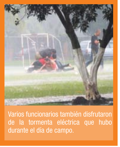
Varios funcionarios también disfrutaron de la tormenta eléctrica que hubo durante el día de campo.