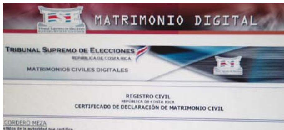
Todos los notarios pueden declarar los matrimonios que realicen a través de la dirección electrónica www.tse.go.cr/servicios_linea.htm . La inscripción de dicho hecho civil se realizará en un tiempo máximo de 48 horas.

La extracción de datos en línea de las propias bases del Registro Civil, su consecuente depuración y la digitalización desde el momento en que se envía la declaración, son parte de los beneficios del sistema, lo que redundará en una inscripción segura, depurada y en tiempos que no superan las 48 horas. Las correcciones de datos a través de interacciones digitales, hacen que las inscripcio-