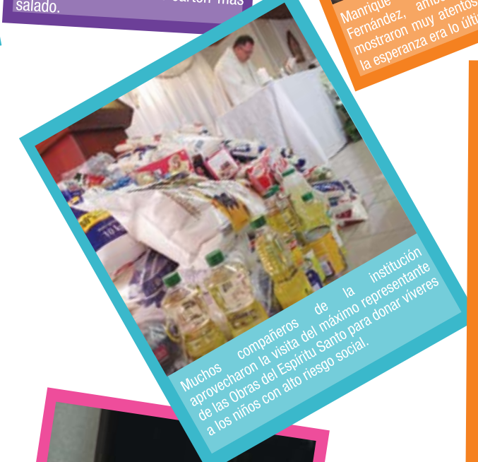
Muchos compañeros de la institución aprovecharon la visita del máximo representante de las Obras del Espíritu Santo para donar víveres a los niños con alto riesgo social.