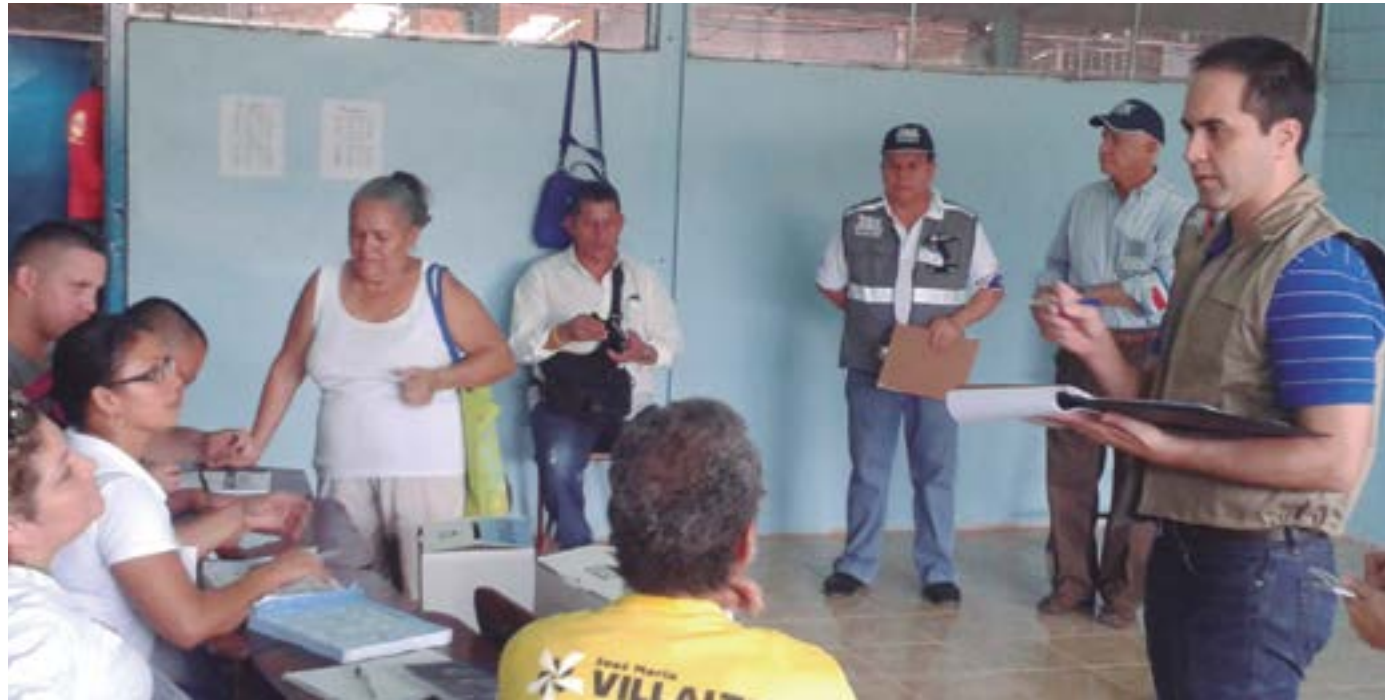
Los observadores internacionales tenían acceso a las juntas receptoras de votos, previa autorización del Presidente respectivo.

Casi 100 observadores internacionales participaron del proceso. Ellos provenían, entre otras regiones, de Centroamérica, República Dominicana, Puerto Rico, Santa Lucía, Perú, Brasil, Colombia, Ecuador, México, Paraguay, España, Estados Unidos, Argentina y Alemania.