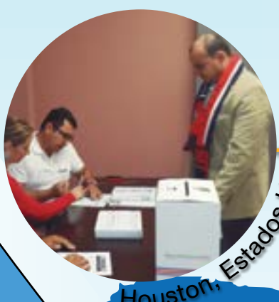
Houston, Estados Unidos.