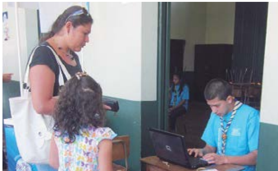
El plan piloto de voto electrónico se realizó en cuatro centros de votación: Liceo de Aserrí, Escuela Joaquín García Monge, Escuela Juan Veintitrés y Colegio Técnico Profesional de Granadilla.

Es importante destacar que se trató de un simulacro, sin efectos sobre los resultados del proceso de votación oficial. Los guías electorales invitaban a los ciudadanos a participar de este ejercicio y los orien-