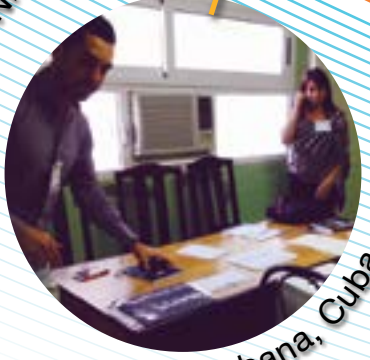
La Habana, Cuba.