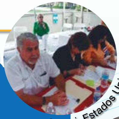
Miami, Estados Unidos.