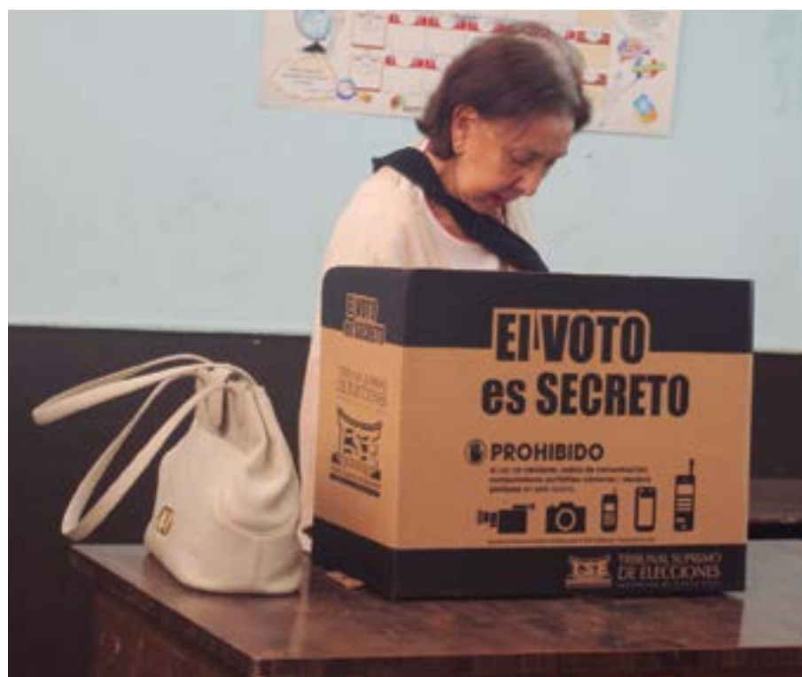
La segunda vuelta electoral se realizará el próximo 6 de abril con el mismo padrón electoral, centros de votación y miembros de mesa.

Asimismo, entra en vigencia el cronograma electoral que regirá para esta segunda votación presidencial.