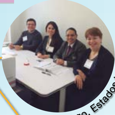
Chicago, Estados Unidos.