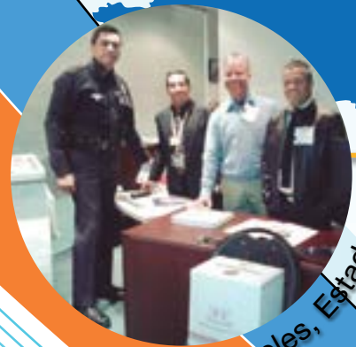
Los Ángeles, Estados Unidos.