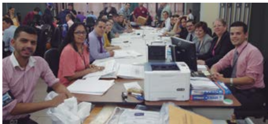
Entre el 4 y el 14 de febrero, más de cien personas realizaron el conteo manual de los votos para Presidente y Vicepresidentes. En la gráfica, la Magistrada Vicepresidenta, Eugenia Zamora (tercera a la derecha) junto a su equipo de trabajo.

La legislación electoral indica que este proceso debe estar concluido