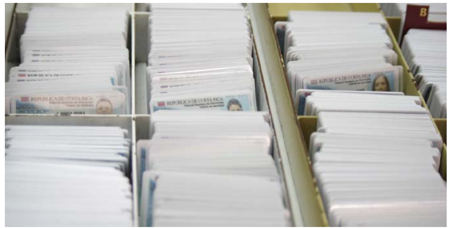
El TSE conserva las cédulas sin retirar por un periodo máximo de 10 años. Después de ese tiempo son recicladas.

se puso a disposición de los usuarios una plataforma virtual en el sitio www.tse.go.cr para verificar si la cédula está lista para ser retirada en Sede Central, regionales o en algún consulado ubicado fuera del país.