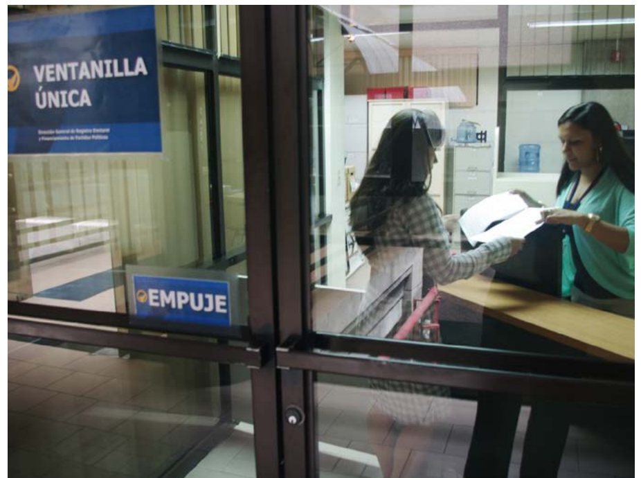
La ventanilla única del Registro Electoral y de Financiamiento de Partidos Políticos se ubica en el primer piso del edificio electoral, cerca de Certificaciones.