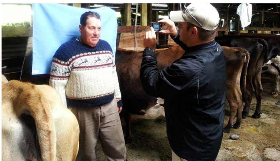
El servicio ambulante del TSE que de manera gratuita llega hasta los cantones de San Carlos y San Ramón ahorra dinero y desplazamiento a sus pobladores.

Del 11 de agosto al 5 de setiembre de este año, funcionarios del Tribunal Supremo de Elecciones