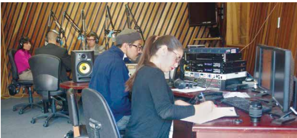
El programa ConéctTSE se transmite en vivo desde las instalaciones de Radio Universidad de Costa Rica.

En Costa Rica los partidos políticos se distribuyen en tres tipos: nacionales, provinciales y cantonales. Actualmente se encuentran inscritos 16 a escala nacional, 11 a escala provincial y 32 a escala cantonal. Estas cifras cambiarán en los próximos meses, cuando ya se emitan las resoluciones finales de inscripción.