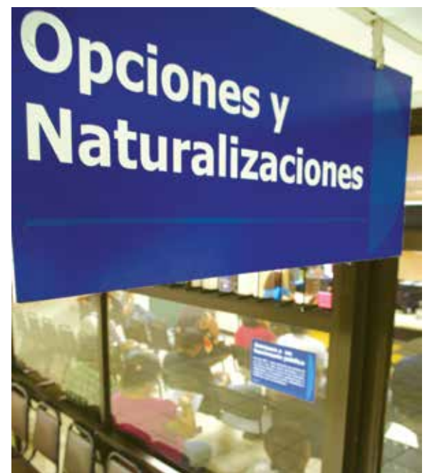
En las pasadas elecciones nacionales se empadronaron 49529 ciudadanos naturalizados mientras que para las municipales podrán votar 52827.

Al mes de diciembre, el padrón electoral lo componían 3.143.725 electores.