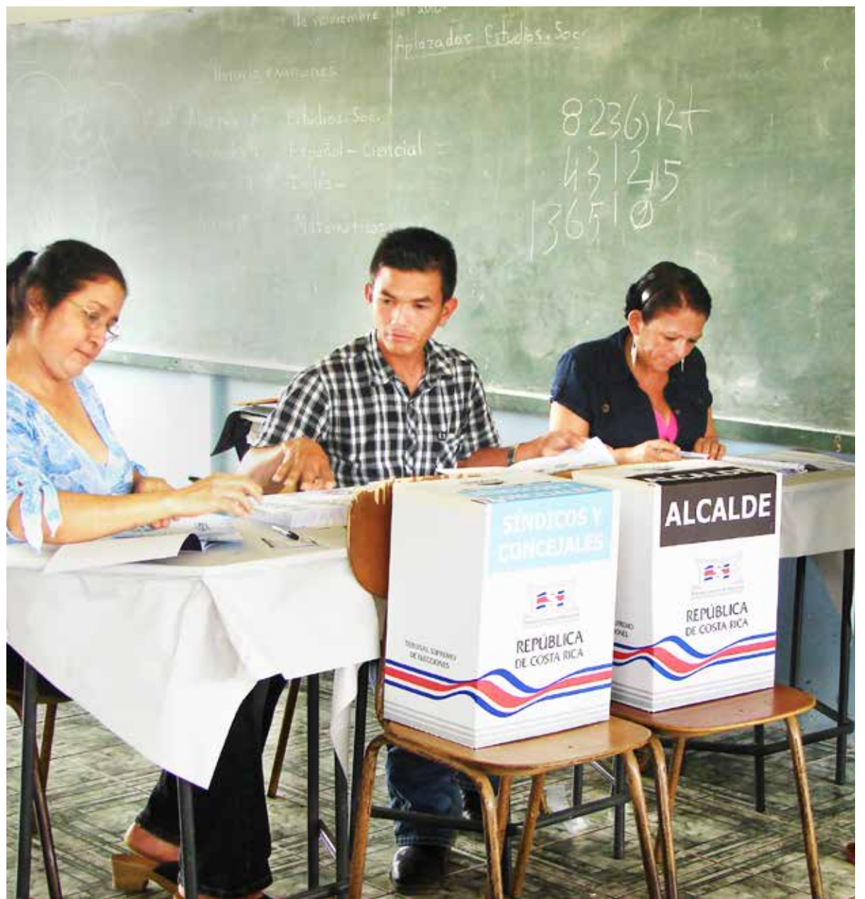
Alrededor de 5700 juntas receptoras de votos serán habilitadas en las elecciones municipales. TSE no descarta la posibilidad de realizar un referéndum en la misma fecha.

En las circunscripciones de Cervantes, Tucurrique, Colorado, San Isidro de Peñas Blancas, Lepanto, Cóbano, Paquera y Monteverde se elegirán concejales municipales de distrito e intendentes. Cabe explicar que estos lugares se encuentran lejos de su cabecera de cantón, razón por la que eligen un Concejo Municipal de Distrito (órgano con autonomía funcional adscrito a la Municipalidad de cada cantón). El intendente tiene condiciones, deberes y atribuciones similares a las de un alcalde.