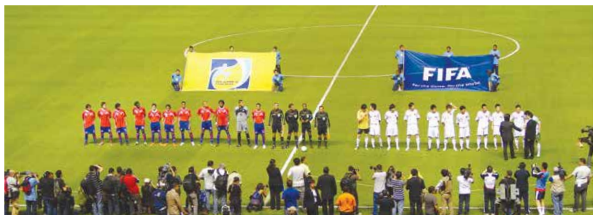
Durante el sábado 6 y domingo 7 de febrero no se podrán organizar partidos de fútbol con motivo de las Elecciones Municipales.

De igual forma, el TSE ha instruido a las autoridades del Ministerio de Salud y a los demás órganos administrativos competentes para que no autoricen actividades de esa índole que se pretenda realizar en las fechas indicadas, instando a la señora Ministra de