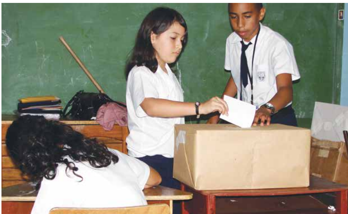
Este año el IFED y el MEP realizaron 120 talleres para capacitar al menos 1800 estudiantes y 600 docentes en materia electoral.

“ Fue una experiencia inolvidable, la recuerdo paso a paso. Aprendí mucho acerca de la importancia de participar en los procesos electorales y sentirme muy identificada con la institución, aprendí acerca de la solidaridad y ni que decir de la tolerancia, tenía que aceptar que otras personas no creyeran en mi propuesta y respetarlo, aprendí acerca de la importancia de la participación, del compromiso y la responsabilidad, valores que aún forman parte de mi vida, son valores para siempre, en otra oportunidad fui candidata y no gané, entonces aprendí que no siempre se gana.”