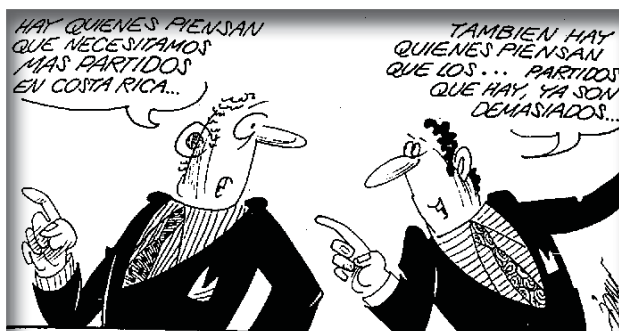
Figura 5 6

Los acuerdos serán tomados por la mayoría absoluta de las personas presentes, salvo en los asuntos para los cuales los estatutos establezcan una votación mayor, según lo señalado por el Código Electoral, Ley N.º 8765, artículo 69, Inciso b).